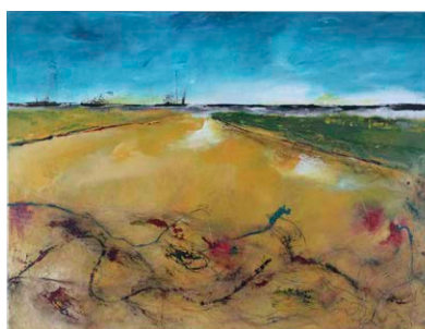
Schilderij: Vera Pieterse

In het weekend van zaterdag 3 en zondag 4 oktober heeft de Kunstkring Woerden (Edisonweg 9b) haar atelierruimte beschikbaar gesteld voor deze veelzijdige expositie. Mantelmeeuw-vrijwilligers exposeren er hun eigen schilderijen,