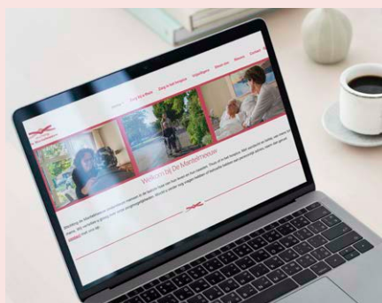
Homepage De Mantelmeeuw

Misschien heeft u het zelf al gezien: de website van De Mantelmeeuw heeft een opfrisbeurt gehad.